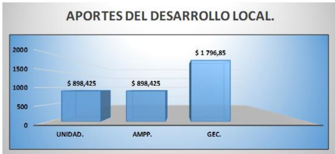
Figura 3. Aportes desarrollo local