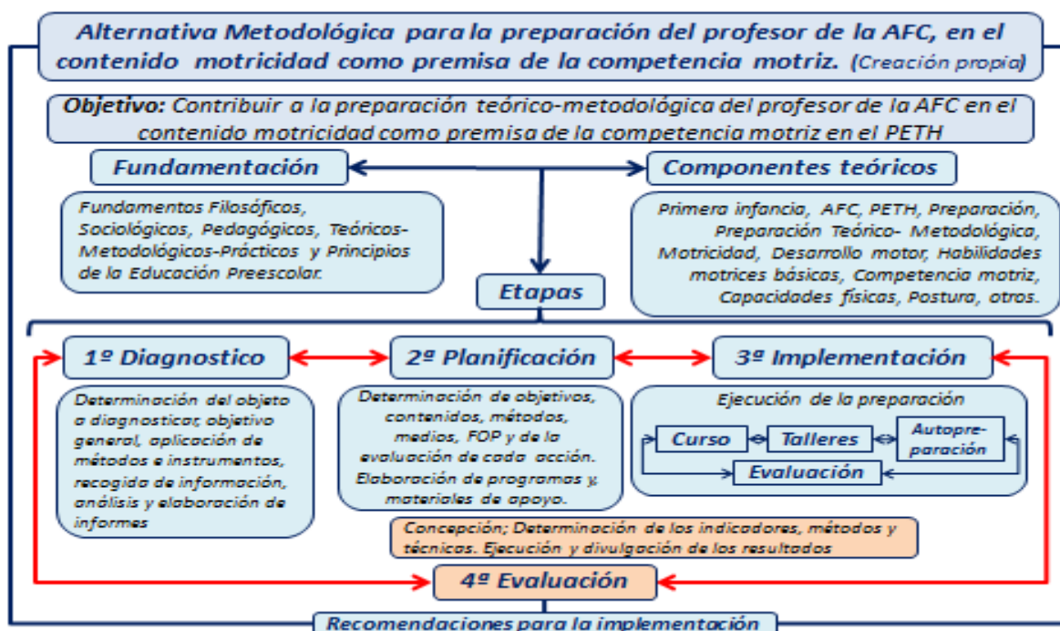
Gráfico # 1. Alternativa Metodológica para la preparación del profesor de la AFC, en el contenido motricidad como premisa de la competencia motriz

Los resultados del estudio exploratorio revelan las limitaciones en la preparación del profesor de AFC y queda plenamente justificada la necesidad de diseñar una Alternativa Metodológica de preparación al profesor de AFC en el contenido motricidad como premisa para la competencia motriz.